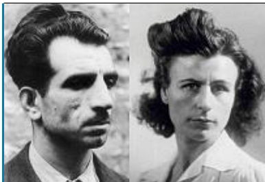
Missak Manouchian et Mélinaée Manouchian, née Soukémian

Précisons qu'à ce jour, la Turquie et l'Azerbaïdjan n'ont toujours pas reconnu le génocide des Arméniens.