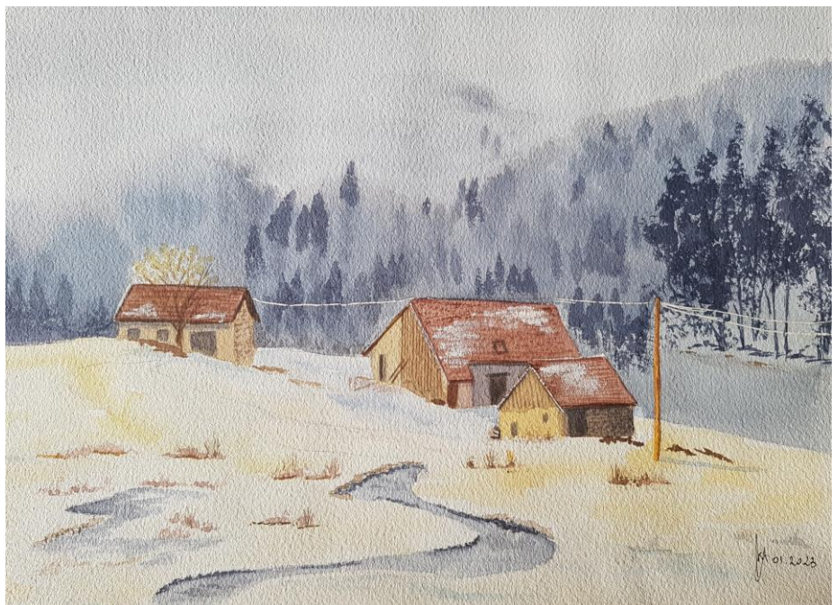
aquarelle, janvier 2023

Joindre le comité : smlh.vincennesfontenay @gmail.com